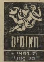
21 במאי - 20 ביוני

מה לך שבוע נפלא. חסדים המתוחים ב יודה יירגעו, ובמקו תבוא אווירה נעי ושקטה, שתאפשר להקדיש את מלוא זומת-הלב לעבודה גרת, נערה, שנדמה שאינה מעוניינת תביא עימה הפ ה נעימה, ויחסי הידידות ביניכם ית קו ואולי במשך הזמן יתפכו לאהבה.