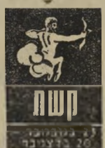
20 בדצמבר - 19 בינואר

אל תסתבך בהוצאות כספיות שאין בהן תועלת. החיסכון מתאים לך יותר מפורנות. היא לא תאהב אותך יותר אם תבזבז את כל מה שיש לך על סטר יות. כדאי שתפסיק ל הסתובב ותשב יותר ב בית. בת קשת: תפסיקי לקנא ולריב איתו על כל שטות. הוא עדיין אוהב אותך, אך אם תמי שיכי לנדנד, יילך למי שהי אחרת. הני נעימה ונשית, ושמרי על יופיך. היזהר משחור המחכה לך מעבר לפינה. לא יהיה לך טיכוי.