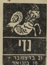
21 בדצמבר - 19 בינואר

השבוע תנחל תבוסה, כתוצאה מעודף הביטחון העצמי המופרז שגילית. אך אין דבר, הירגע, מפני שבסופו של דבר אתה עשוי להפיק תועלת מפסיק להתרוצץ ות שב קצת לחשוב על הבעיות אשר מטרי דות אותך באמת, ולא על אלה שנדמה לך. הקדש את מלוא המי רץ להתקדמות בעבור זה ותיווכח שזה משתלם. בת גזי — אל תבזבזי את כל כספך על בנדים.