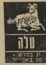
21 במרץ - 20 באפריל

הר מידיך הטוב. יות אדישותו לכ יות לבעיותיך, הוא ל לנקוט צעד מדי לן, שכדאי שתהיה לן לקראתו. אל לייט החלטות חפו ואל תסתכסך חבויך לעבודה. טלה — בחיי ה בה שלך יחולו השבוע שינויים מר קיי-לכת. אל תהססי לגלות לו אהבתך.