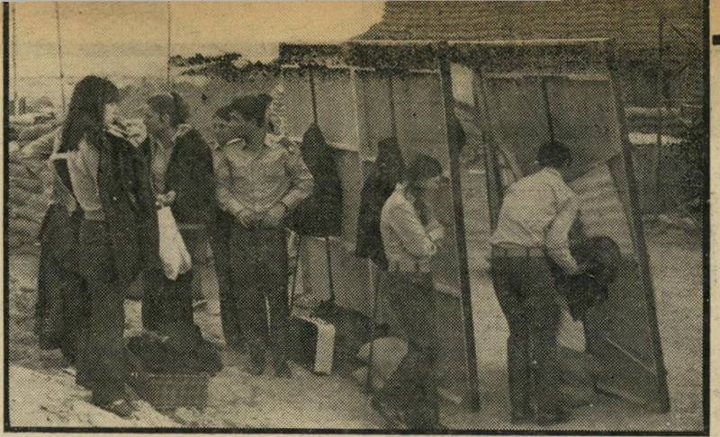
חדר הדבשה במעון בסיני

פסיכופאת הרוצה לפוצץ את המטוס כדי שאשתו תזכה בדמי הבטוח. במקרה מורדיעה הדיילת לטייס, כמה דקות לפני ה- המראה כי היא נושאת בקרבה "נוסע סמוי" ואין לה כל ספק מי הוא אביו. ו- רק במקרה טייס זה הוא גיסו של מנהל נמלי-התעופה. ורק במקרה, כמוכן, דורשת אשתו של זה, גט, דוקא באותו יום. וזה, עוד לא הכל. במקרה ישנה גם אשה חוקית ל-