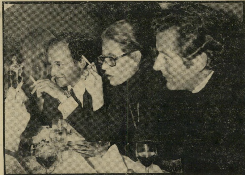
פיטר טאוונסנד (מימין) ומארחים בישראל *

בארץ זיהו אותו מעטים, ורק גברת קשישה אחת במלון דן אמרה לו בנימוס: „בוקר טוב, מר טאוונסנד.”