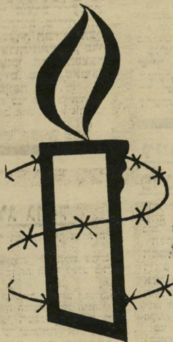
סמל אירגון "אמנטי"

העולם, הרי נקטו בשיטות הכושפות ביותר. תחלה נערך הקרב באו"ם. כאשר הח-