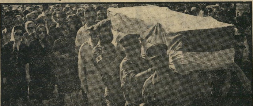
מסע ההלוויה: "יחד עם האנשים הפשוטים..."