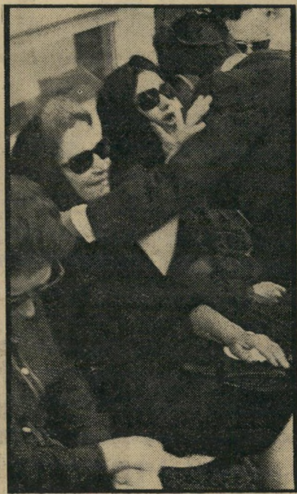
יגאל אלון מנחם את הבת