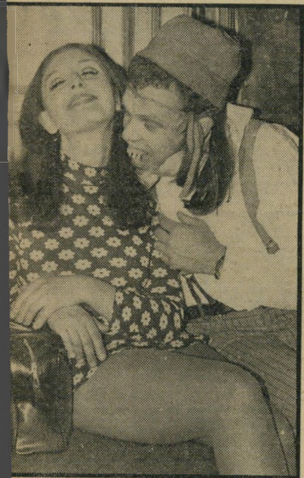
בוהאהא סרט האימים של רומאן פולונסקי השפיע על מת' צפשים רבים, שתקעו לפנייהם ניבים וניסו בשובבות לנשך כל מיני חתיכות בצוואר.

קוסיגין במאנדיס נערך קרב תרנגולים. זאת אומרת כימעט נערך, מפני שהנוגעים בדבר התגלו כפאציפיסטים לא הרימו זה על זה יד או רגל, למרות ההפצרות ועידודו של הקהל. גם תרנגולת שהובאה במיוחד לזירה, כדי להלהיט את יצרם לא הועילה. בתמונה — התרנגול קוסיגין וידו מאז לוטשים עיניים. לפני תחילת ה"תחרות" הימרו החוגגים על נצחון קוסיגין שעשה רושם מאיים.