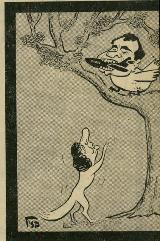
זמיר, זמיר, לפחות תשיר לי שיר!"

לצורך זה, ייתכן אפילו הסכם בין יריבים אישיים, כדי למצוא מועמד משותף. ייתכן אף, שיהחלט על ביטול החלוקה הנוכחית של סמכויות המזכיר, בין מזכיר כללי ושני מזכירי-מישנה. מועמד שישמו הזוכר בהקשר זה: יגאל אלון.