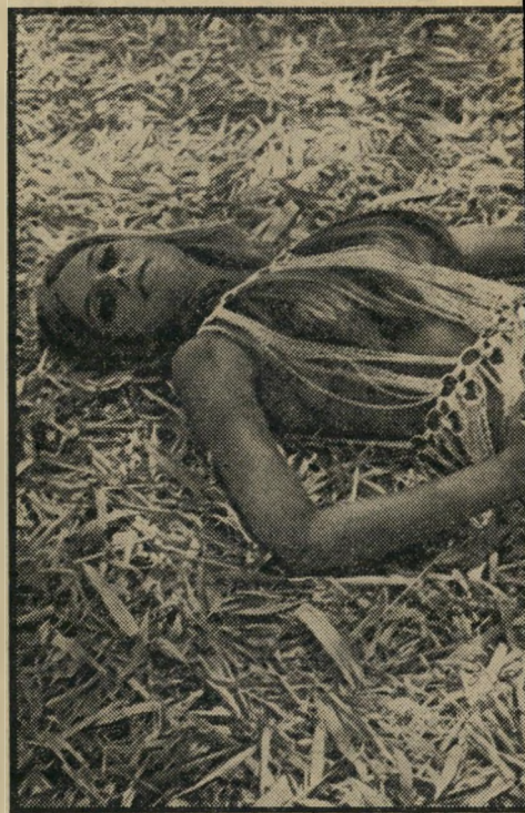
העולם הזה, כאשר השתתפה לפני שלוש שנים בתחרות ס, הוכתרה בתואר נסיכת הים התיכון. לפני שנה של מיס אלגנס. אכן, יש בה משהו, בלי כל ספק.