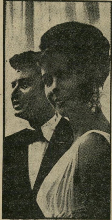
אדני פיישר ולין טיילור —

האכזבה הגדולה שלי, השבוע — לא נעים לספר — היה לא אחר מאשר אדני פיישר המפורסם — גרושן של אלילות-הבר לין טיילור, דבי ריינולדס וקוני סמיי כנס (ביטוי יפה, אלילות-הבר). מה הן מצאו בו? שאלתי את עצמי ביום שני השבוע, כאשר ישבתי מולו בדירת הנשיאים במלון שרתון התלאיבי: אדי זה גדול היה לביש חלוקי-רצה שחור (זה עוד כלום — ברחוב הוא הולך במכנסים ורודים) וחולצה פתוחה עד החגורה, שכה אחיה, מרכיב משקפיים, לא מגולח, סניו מלאי חטטים, והוא מהמהם ללא הרף קטעים מ' כנר על הנג — ועוד באידיש, לא פחות