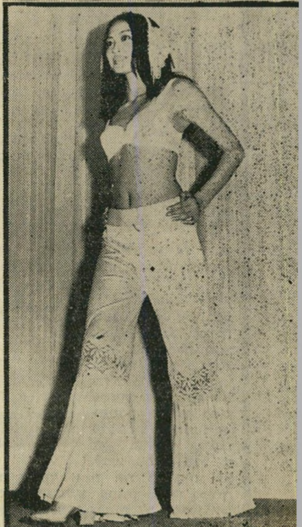
מימין לשמאל: לבוש מקסים להרמון; מחוך בצבע האור; חלוק שקוף מעל חזייה ותחתונים; בגדיים-מחוך