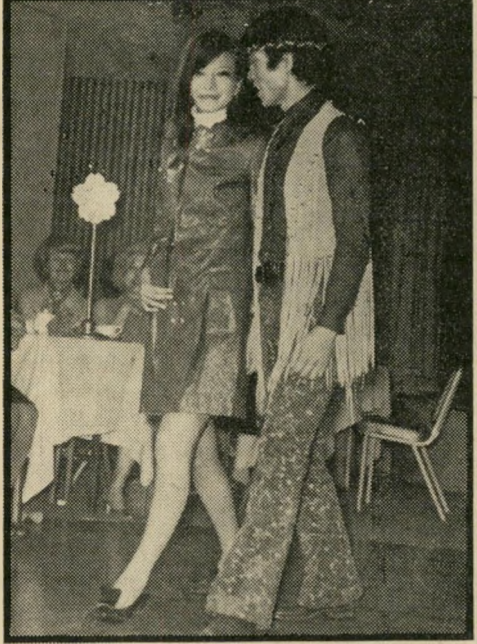
ב.הילטון של סוקו, שם נערי כה תצוגת האופנה הישראלית, הוצגו גם בגדיינור ישראליים.