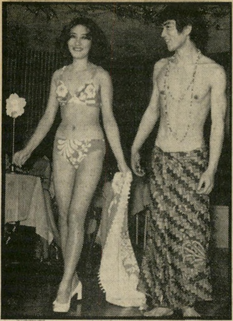
אופנה צמד דוגמנים יפאניים מציג בגדיים ותלבושות יחודיים מ תוצרת ישראל, לעיני קניינים יפאניים.