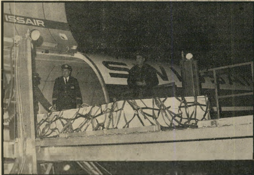
ארונות הניספים מורדים ממטוס-המיטען

— של קבר אחים כולל בירושלים. אולם כשהתקשרה הנהלת טוויסאיר עם משפחות אנשי הצוות הסתבר כי כמה משפחות רצו שיקריהם ייקברו בשווייץ.