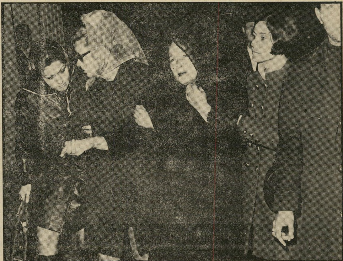
קרובי משפחה מוכי יגון מקבלים את פני ארונות יקיריהם. בתמונה משמאל: אחת האבילות התעלפה