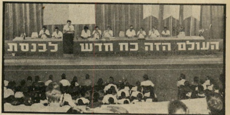
הוועידה הראשונה של תנועת העולם הזה - כוח חדש

אם לא קיבלת טופס, פירושו של דבר שאין שמך מופיע בכרטיסיה. במיקרה זה -