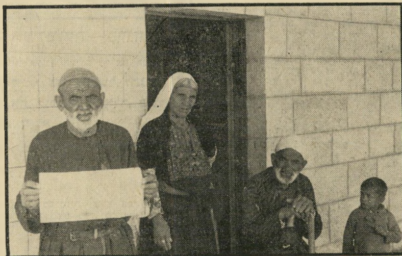
בעל-קרקעות בבית-שאחית מציג את כתב הבעלות