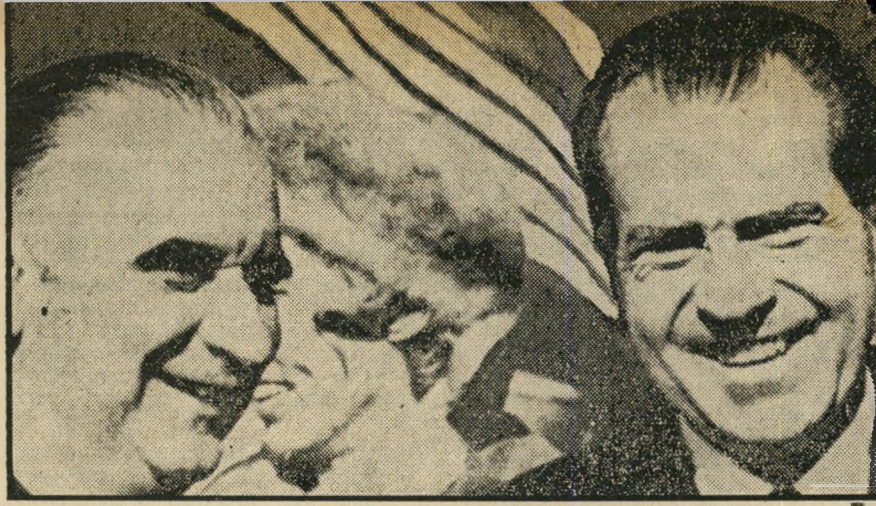
מארח ניכסון ואורח פומפידו בוושינגטון למי נאמנים יהודי ארצות הברית?