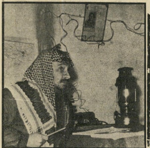
מנהיג האירגון לשיחרור פלסטין, המקיים מישרדים בבירות מדינות־ערב ובמיספר מדינות אירופיות, אשר יכולים לשמש כיעדים להתקפות. אולם פגיעה במשרדים אלה לא תפגע באירגון אל־פחה.