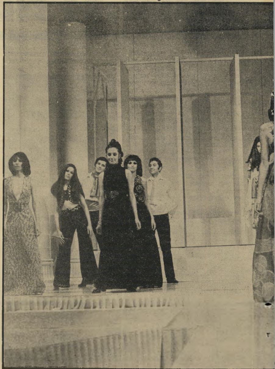
במרכז — שמלת-ערב עשויה מבד ריפוד