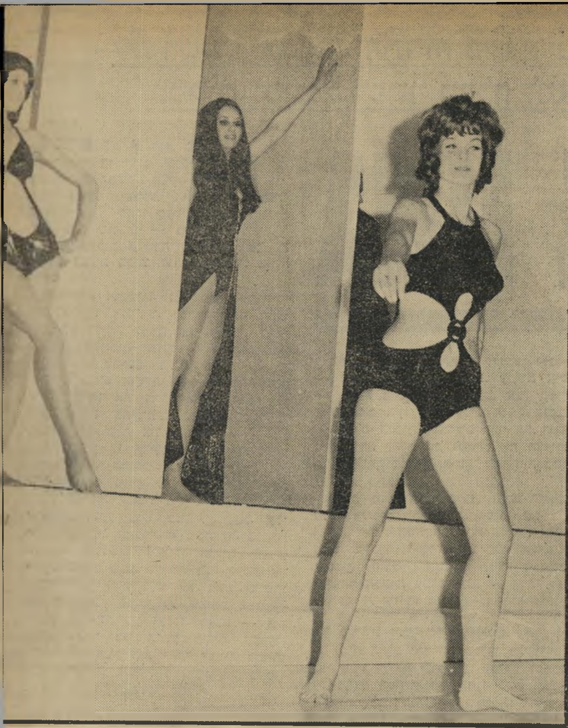
בגדי-ים: הבגד היחיד שבו לא נחשף החזה