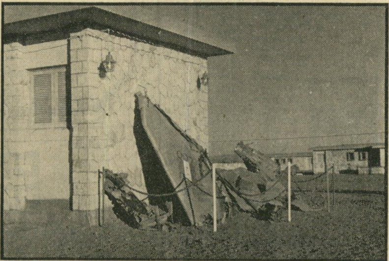
בית־מגורים באבורודס בחצר -- מזכרת מצרית

הסיגריות מהוות רק חלק זעיר מ־ הברחות הענק, הכוללות חשיש ומצרים