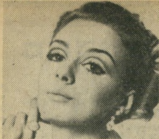
פעם אהיה שחקנית