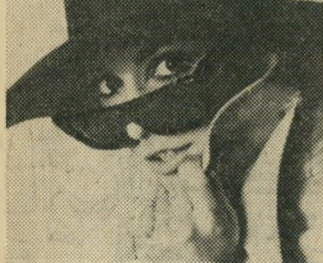
או מרגלת בינלאומית

לפני שאת כובשת את הבמה בסערה, עליך ללמוד להיות שחקנית -- זה ברור. הגיוני גם שיהיה לך קל יותר להיות אשה בוגרת ומלאת חן, אם תלמדי עכשו דברים מסוימים. כגון: עמידה נכונה, דבור נאות ונימוסים. קיימים גם דברים אחרים המקילים על הנשיות. טמפוני טמפקס, למשל. ההגנה ההיגיניית לשימוש פנימי, שפותחה ע"י רופא.