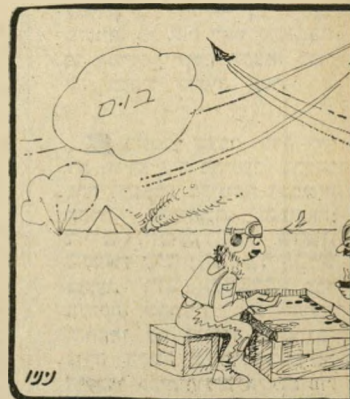
"חוכמה גדולה... אבל נראה את הישראלים בשש-בש?"

טיבוע הספינות בחוף אילת, לא היתה פעולה מסובכת במ'י יחוד, מבחינה מיצועית, זה די פשוט... לומר הרמטכ"ל. באשר לבום שביצע מטוס סורי מעל חיפה, אמר הרמטכ"ל כי "מבחינה מיצועית זו פעולה פשוטה מאוד...". הארץ, 8.2.70