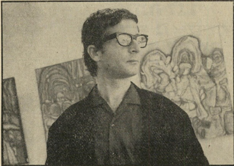
צייר פרסבורגר בפאריס בלי קורת-גג

לפני חמש שנים עלידי העירייה הפאריז-סאית ומשרד החינוך בראשותו של אנדרה מאלרו.