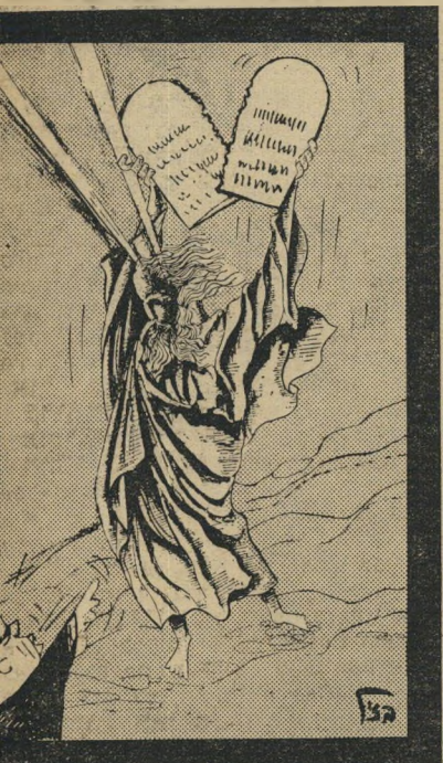
"חזרו למצרים!", עננה כבדה

חלק מהמפגינים נראים מסתערים על גדר הכנסת. במציאות נשאר רוב היפגינים תלויים מרצונם הטוב על הגדרות, כשהם קוראים במקלה לראות בבירור את האווירה המתונה הסתרי-הזעם ששררה בהפגנה.