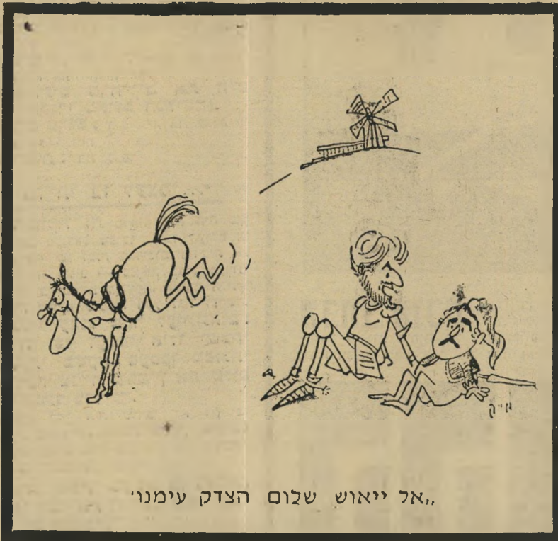
„אל ייאוש שלום הצדק עימנו“

בישיבת ועדת-הכנסת נכח גם היועץ המשפטי לממשלה, או נציגו. מכיוון שלא רצו או אינם יכולים להביא אותי למשפט