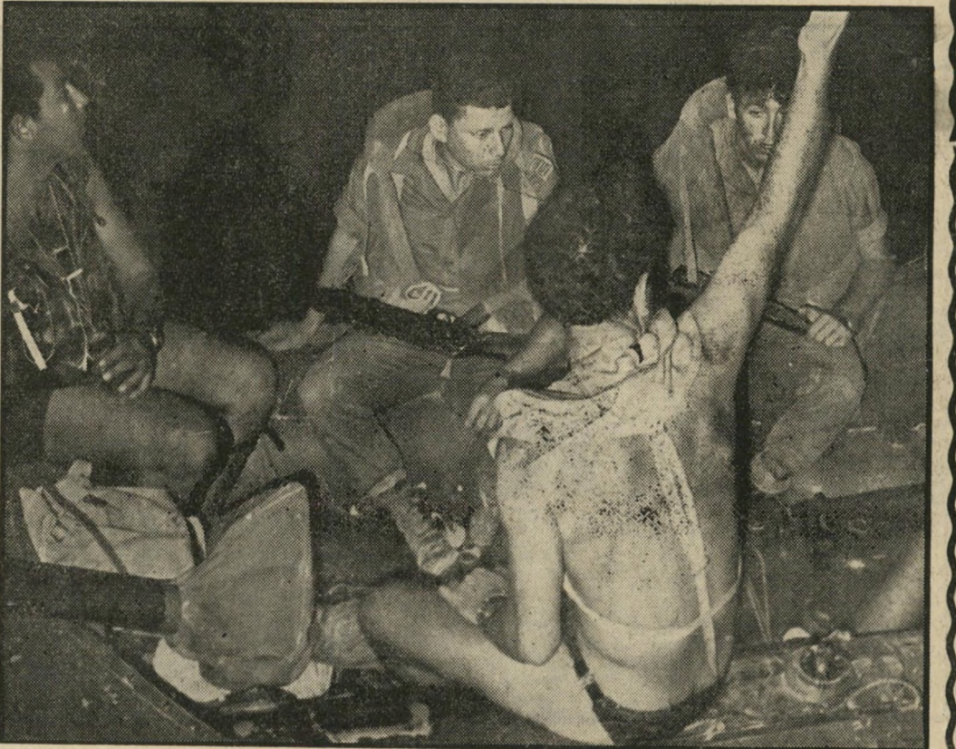
השתתפותן בפשיטות של צה"ל במירץ סואץ. בתמונה נראים אנשי קומנדו ימי וחיללים אחרים בשעת יציאה לפשיטה.

בסוף חודש אפריל 1969 התרכז מיבצע ההתבצרות של צה"ל בתעלה, בסתימת הפרצות בסוללת העפר המתמשכת מקנטרה צפונה עד למוצבים הצפוניים של צה"ל בתעלת סואץ. המצרים ניסו להפריע בכל האמצעים שבידם לסתימת הפרצות, כדי לאפשר לרכב צה"ל לנוע באיזור בהסתר. צי הטראקטורים, שהובל לגיזרה הצפונית, לא סייע בה' חילה אלא סיוע מועט. בעיות עבירותו של הצי המיכני הכבד בדרך החשופה והיחידה, השוקעת שוב ושוב בשולי הביצה, הכבידו מאוד על הגבחה הסוללה. לגיזרה הצפונית הובלו פחים, קרשים ושקי יוטה כדי להסתיר את העובדים מעיני המצרים, שהוסיפו לירות ימים רצופים. לילה אחד הונחו הפחים על-גבי הסוללה. בעלות השחר הועפו הפחים ממקומם בפגיעות ישירות של תותחי הנ"ט מעברה השני של התעלה. מן ההכרח היה לבקש פתרונות אחרים.