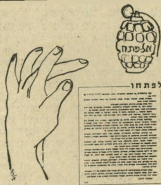
* שנועון הסטודנטים של אוניברסיטת תל-אביב *

נראה לי שטוב שלפחות ציבור הסטודנטים שים בישראל, יכול ללא גיונים וסלפולים מיותרים, ששום עיתון אינו יכול להרשות לעצמו, להביע את דעתו בצורה ישירה וקולעת.