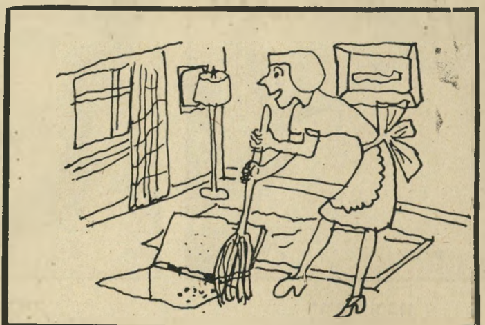
פזיאשפה בריצפת כל חדר