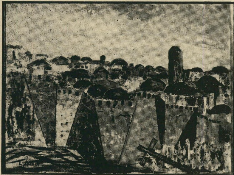
"חומות ירושלים" של ליליה עלוש הסתה או תעודת-כבוד?

אחרי שסיים את לימודיו ברכת-עמון עבר להתגורר בירושלים לפני תשע שנים. שם הפך לעיתונאי, היה כתב סוכנות רויטר ועיתונאי בעתונים הירדנים אל-מנאר ואל ג'יהאד. הוא מצויר מזה 10 שנים מבלי שקיבל הכשרה מקצועית לכך מעולם. ליליה עלוש היא ילידת ירושלים. מאז ילדותה נהגה לצייר על כדים או לקשקש