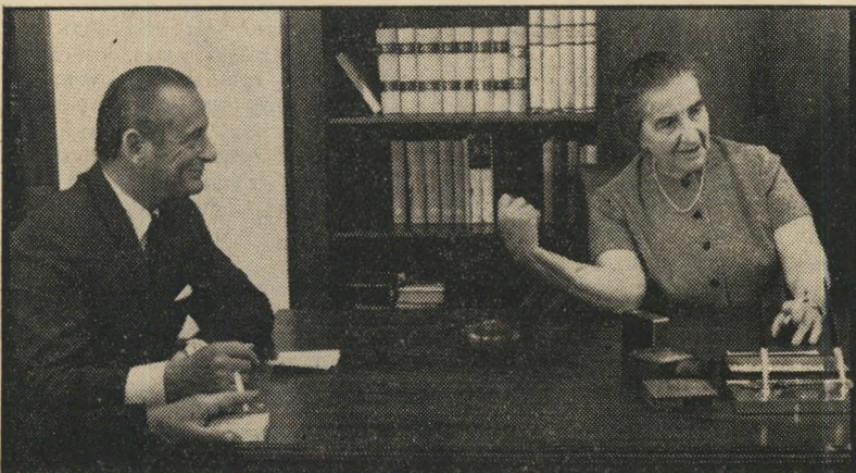
מארק מושביץ עם גולדה מאיר

איגרות-חוב לא תגדיל את מחזור הכספים, תעזור למנוע אינפלציה ולשמור על יציבות מחירים. הוא הירצה את הצעתו באונו גולדה מאיר במשך שתיים — והיא לא הגיבה. את פנתס ספיר, לעומת זאת, הוא שבה לגמרי. אבל ההסתדרות מתנגדת לכן, על אף הליטות המיסיונרית בי-שיחות ובטלוויזיה של אי-השקולד, רו-אים הפועלים וראשי ההסתדרות בהצעתו גלולה מרה. הם מעדיפים את הסוכריות — במזומן, עכשיו.