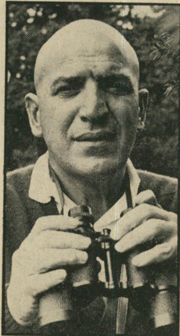
סאבאלאס ב"נזכרים בצמרת" עסקים במקום שוד

הזוג המדובר ביותר בפאריס בימים אלה הוא המלחין-זמר-שחקן סרז' גינבורג, ו' ידידתו ג'יין בירקין. הם מאוהבים כבר