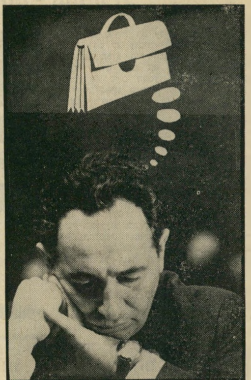
שר בלי תיק שמעון פרס