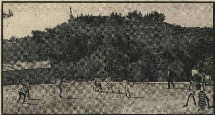
נערים שפוטים כמוסד "יידיה" משחקים כדורגל בצד המדונה רצח בנבעה