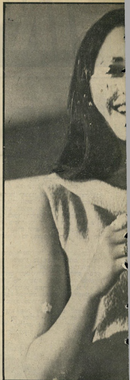
ר, עם פנים מרוחים בקרם

מסיבת הסלפסטיק הגדולה נערכה ביריד המזרח. המסיבה למסיבה סיפקה חברת הניקוריהיבש קשות. יצתה להוכיח שהיא מסוגלת לנקות בגדים גם אחרי שנא כזו. היא סיפקה לחוגגים את העוגות, העמידה