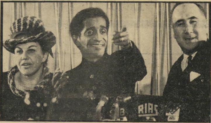
עם סמי דייויס