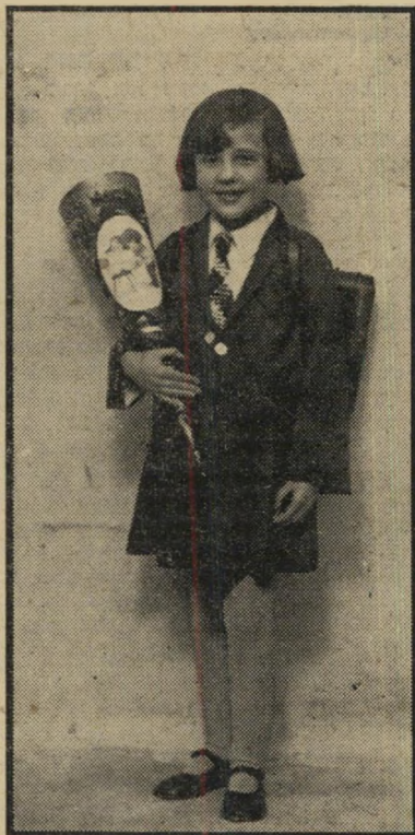
ההתחלה בגרמניה ההתחלה בישראל כעבור שלוש שנים, בגיל תשע, אני כבר צברית. כאן, לידי הקאזינו שעל שפתי־הים — עם כלבי