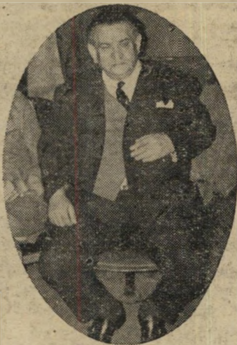
חצקל: לא עצם עין

איך שהזמן עובר. לא מספיקים להגיד ג'ק רובינסון, וכבר עוברות 25 שנים. האחד רון שזה קרה לו הוא התיאטרון הקאמרי.