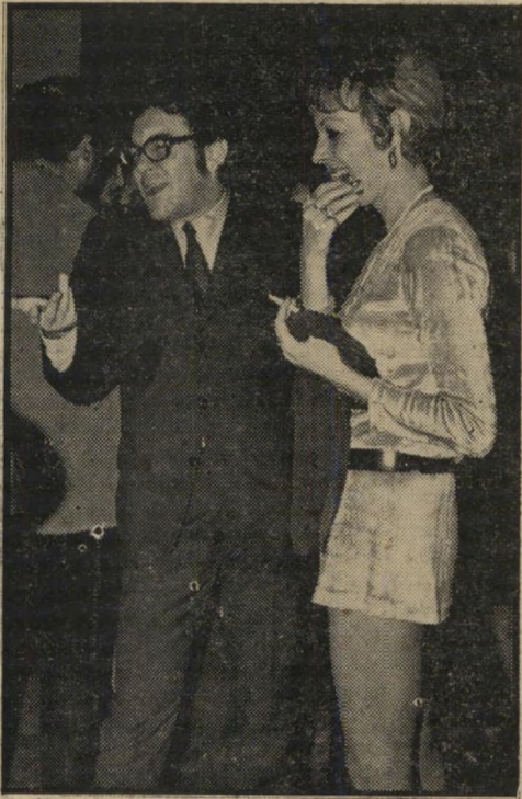
נאמן ובן-גוריון: בערבית

איך שהזמן עובר. לא מספיקים להגיד ג'ק רובינסון, וכבר עוברות 25 שנים. האחד רון שזה קרה לו הוא התיאטרון הקאמרי.