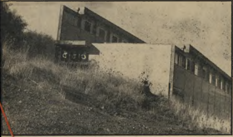
בית-הספר ללא תלמידים בטבריה. כיתות לאהבה חופשית

הקטע "תומס חוזר", למשל, מבוסס על סיפור אותו שמע גיאד מידידה שלו. טוב.