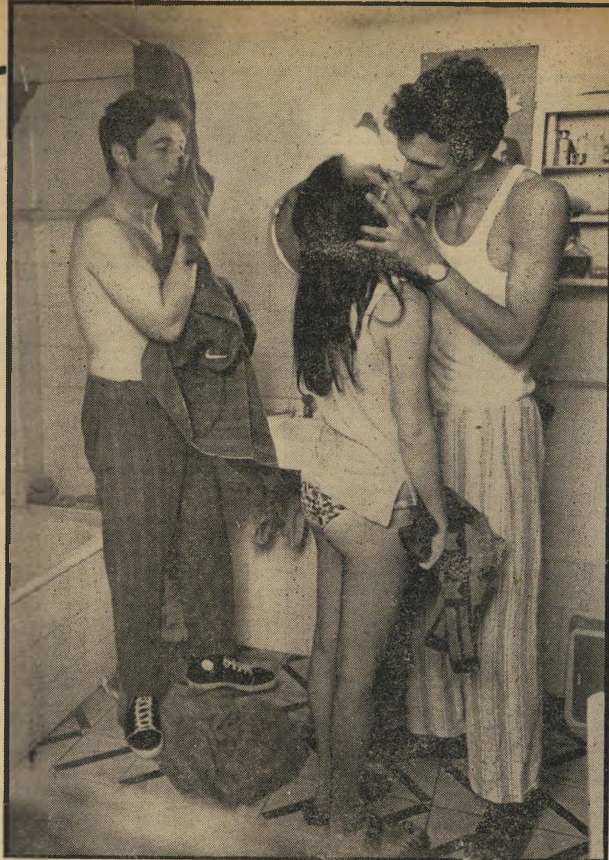
באמבט — תומס חוזר, עברית של יום יום, בלי קיבוצים וכלי ציונות.

רופאים שונים הביעו בימים האחרונים את דעתם, כי אם היה משרד-הבריאות עתה דיו לדיחותם של ארגון-הבריאות הבינלאומי, ניתן היה לחסן לפחות את העובדים ה-