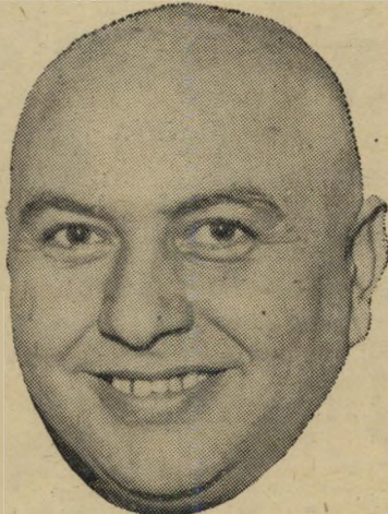
מומו אחרי הנדר

נדרתי נדר: אם נבחרת ישראל בכדורגל תגיע למכסיקו, אני מגלה את שער ראשי.