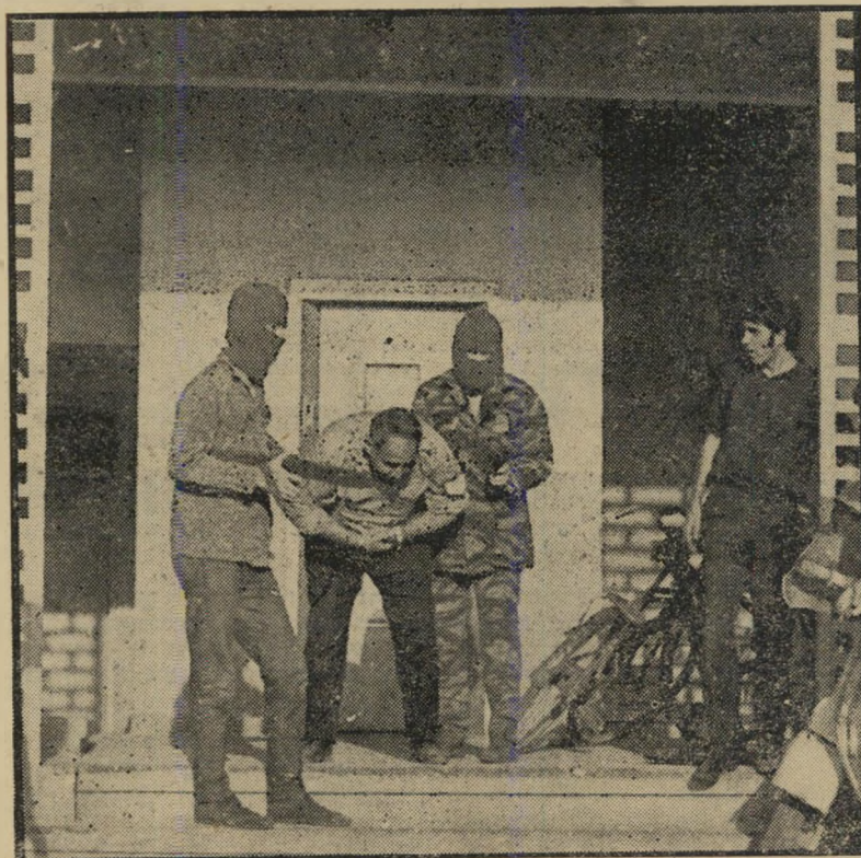
בצורה זו יצאו שני השודדים המזויינים שהיו בתוך ה-מלטשה מהבניין, בגרמם איתם את סמל המשטרה הפצוע.

משום כך לא ניסו או השודדים אפילו להתקרב אל הקופה. הם המתינו עד לשעות הבוקר המוקדמות. כאשר ראשוני הפועלים מגיעים אל המלטשה יחד עם מנהל העבודה, כדי לחלק את היהלומים למכונות הליטוש, או הצליחו השודדים להכריח את הפועלים למסור לידיהם את היהלומים, ניסו להימלט עמם דרך חדר המדרגות. אולם בדרך נתקלו