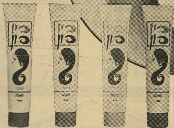
„ביו פון” אדום לשיער שמן „ביו פון” ירוק לשיער יבש „ביו פון” זהב לשיער עדין „ביו פון” כחול לכל שיער