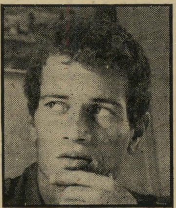
אבנרי אחד מחיילי היחידה הממונה על השמירה. 16 שעות עבדו זה ביום 24 שעות כוננות, הם סדר יומו.