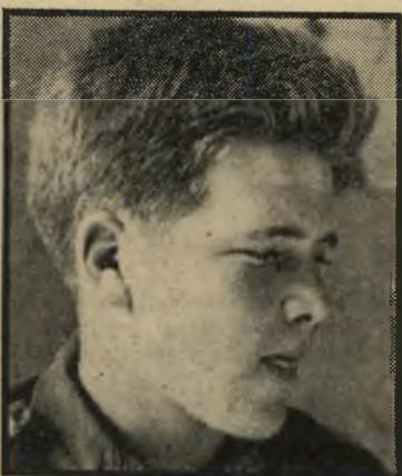
ניר אחד החיילים הצעירים ביחידת הג"בול הנשכח, המאבטחים את הגבול הפרוץ והארוך ביותר של מדינת ישראל.