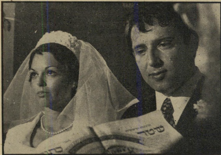
הזוג הצעיר שרוז: בלי עין הרע

אחת חווה, בעלת גוף משגע ושיער בלונדיני, והעיקר, אמא ששומרת עליה, שלא נדע מצרות. אבל באותן דקות בודדות ש- היא השתחררה מהאמא, הפגינה החחה הזו