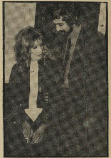
ז'אק והלית: בגלל הכיוון

לראות את הלית מלפנים ומאחור, מלמעלה ומלמטה, עם בגדים וגם עירומה. רק כשכל הדברים האלה נגמרו, זכו ה- נוכחים להזין את עיניהם באוריגינל, שסוף- סוף הגיע ועלה לבמה להחזות קידה קלה. רק אז התגלתה הסיבה האמיתית להעדי- רה של הלית בפתיחה. הלית פשוט בייש- נית. לא נעים היה לה להסתובב בין ה- מוזמנים לבושה בבגד המפורסם שלה, זה עם החץ. במיוחד בגלל הכיוון של החץ. מרחוק, על הבמה, לא איכפת לה.