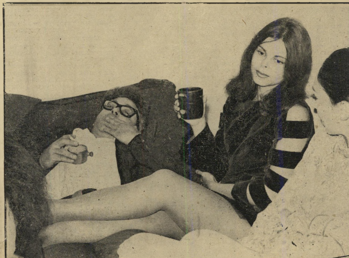
פז ובראל תפסו שלושה. להלית: בלבול מוח

בלית ברירה כבו האורות, והנוכחים נאל- צו להסתפק ביישותה הקולנועית. אפילו ה- צלמים ארוו את המצלמות, ונכנסו לאולם