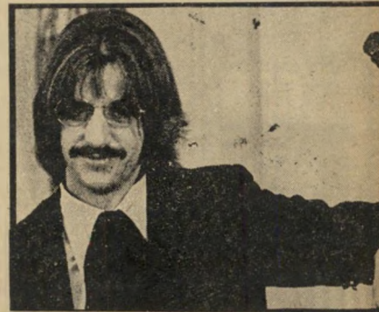
רינגו ב"הנוצרי המופלא"

סצינה מוזרה כזו אמנם מתרחשת, ב" סרט. זהו סרטם החדש של פיטר סלרס ורינגו סטאר, "הנוצרי המופלא", ש" יועלה בימים הקרובים בהקרנת הבכורה בלונדון, בניכוחות הנסיכה מרגרט. רינגו מגלם בסרט תפקיד של ביטניק חסר בית, המסתובב ברחובות וישן על גבי ספסלים בגנים הציבוריים. עד ש- הוא פוגש, בוקר אחר, בג'נטלמן אני- גלי, יאנגמן גראנד (פיטר סלרס), שהוא האיש העשיר ביותר בעולם, המציע ל- רינגו לרשת את המיליונים שלו.