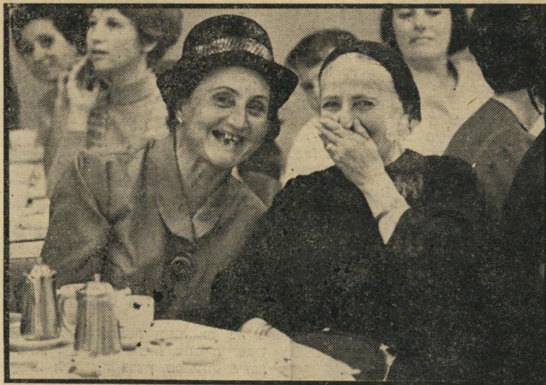
חי ... חי ... חי ... חי