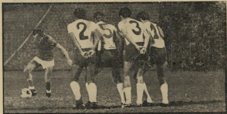
הכדור נשאר על הארץ