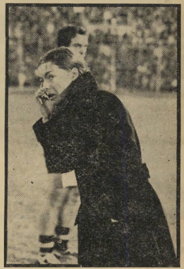
שניידר: ציפיה לגול

חצי שעה לפני הזמן, ושילמו לירה כל אחד תמורת הזכות להיצטלם. כולם כאו מלאי רצון טוב, ומוכנים מבחינה נפשית לצעוק בוז! בכל כוחם ברגע שיגידו להם. בינתיים, עד שההכנות האחרונות יסתמי- מו. בידר את כל הקהל הזה של כוכבי כדורגל על המגרש וכוכבי קולנוע ביציעים אריק איינשטיין, יחד עם להקת הצרצרים של הפילהרמונית. הצלמים מטעינים את המצלמות. הבמאי נתן הוראת אחרונות. רומי שניידר אר- מרת: היי! והכל מוכן ומחכה לריצ'ארד