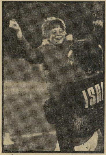
קים: על באמת

מה שקרה השבוע באיצטדיון בלומפילד הזכיר את העיר חלם. הו שם השחקנים של בית"ר תל-אביב. כ" משך שבוע התאכזו יחד עם ריצ'ארד האריס, השחקן הראשי בסרט בלומפילד, שמאו ש" אורי זוהר פרש, הוא גם הבמאי. הכל היה מוכן להצגה הגדולה - מישחקו האחרון של כוכב הכדורגל המודקן האריס. לפי התסריט, ריצ'ארד צריך לתקוע גול אחד, לפספס שניים, ולקול שריקתה הבוז של קהל אלפים לחתום את הקריירה שלו כ" שחקן כדורגל. ואז, אחרי שכל אוהדיו נט- שוהו, הוא עומד בודד ועצוב במגרש, וכל מה שנישאר לו בחיים זה ילד קטן אחד שאוהב אותו ורומי שניידר. לאסוף את קהל האלפים לא היה בעיה. 15,000 איש מילאו את האיצטדיון עוד כ"