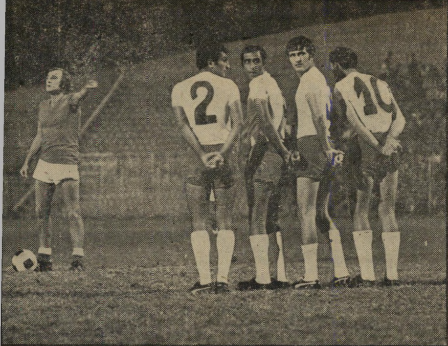
האריס: ניגש לקו השש עשרה