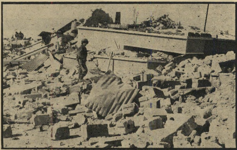
עונש סביבתי בעזה

גולדה מאיר אינה יכולה להרשות לעצ-מה, לא בממשלה הנוכחית ולא בממשלה הבאה, את פרישתו של משה דיין, העשויה למוטט את הקואליציה שתקים. משום כך, אחרי שתחתוך ותחליט בין מפ"ם לגח"ל, יעמוד בפני גולדה מבצע נוסף, קשה פי-כמה: לחתוך בין דיין ואבן, או למצוא נוסח שישיב את הנץ וישאיר את היונה שלמה.