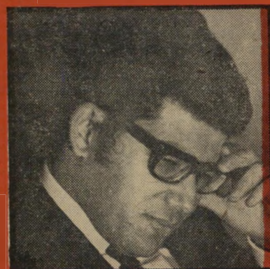
פרקליט יהודה רסלר