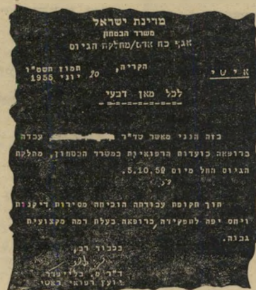
במשך דרכי הכיבוש היתה רופאה — שערקה לארץ אבותיה

להיחלף כבת לעם הלא נכון: בכל עם אחר, היתה זוכה לכבוד ויקר. בעמה שלה, זכתה — כתודה על מעשיה — להשפלה וייאוש. זהו סיפור חיים מופלא: סיפורה של אשה צעירה, שהעזתה, אומץ ליבה וכישרונה הברזים יזכו אותה, בצבא האדום, בעצם ימי מלחמת העולם השנייה, ב-18 אותיות הצטיינות — בנייהם שניים מהחשובים בירי, את מיסוד לנין ואות הכוכב האדום — ובדרגת אלוף-מישנה.