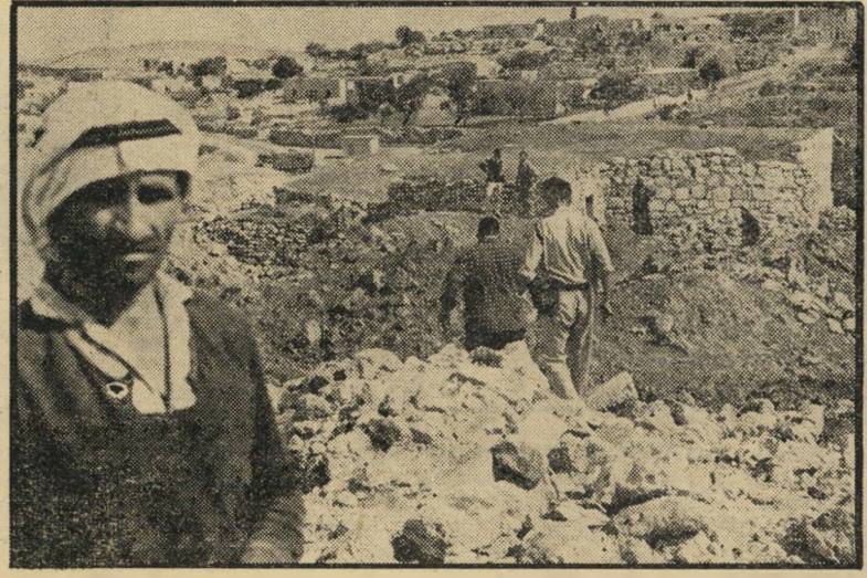
חלחול-אחרי תושב ערבי בחלחול ניצב על ההריסות אחרי שביתו פוצץ. לידו נראים יורדים מגלי ההריסות שוטרי משמר הגבול. התושבים דזרו אל בין ההריסות, כדי לנסות להוציא משם שקי שנורה שאיחסנו בבתיים.