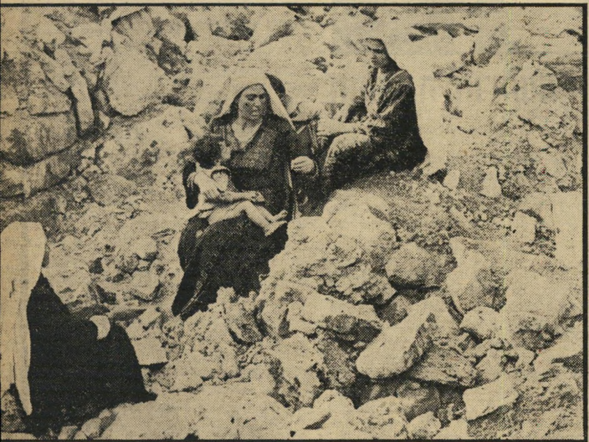
לא רוצות להשלים שלוש ערביות עם ילדיהן יושבות על חורי בות בתיהן בחלחול. כתוצאה מפיצוץ 18 ה' בתים, נשארו כ-150 תושבים ללא קורת גג, נאספו לבתי שכנים בסביבה או עברו למערות.

הציגו שילטונות הממשלה-הצבאי את גיר- סתם שלהם. לדברי הנוגעים בדבר הוחלט על פיצוץ הבתים בעזה אחרי רצח הסוחר שלמה לוי, רק אחרי שהסתברו למעלה מכל ספק העובדות הבאות: ● הרוצחים שהו ברחוב שעה ארוכה לפני שנכנסו לתנוה וירו בסיחר. הם הסי- תוכבו בחנויות ברחוב, ישבו בבית-קפה והמתינו לבוא הסוחר. יש להניח שכל ה- אנשים שהיו אותה שעה ברחוב ראו את השניים וידעו כי הם ממתינים לסוחר ה- יהודי, והיה ברור להם גם לאינו מטרה. ● לאחר שנרצח שלמה לוי, הוא היה מוטל בחנות במשך שעה וחצי מבלי שאיש מהשכנים ותושבי הרחוב, ששמעו את ה- יריות, ידוה על כך לשילטונות. אולם, גם אם גורמים אלה הוכחו מעל לכל ספק, אין להסכים שעונשים במיקרים כאלה יוטלו בחתף ובמהירות. אם אומנם אלו הן העובדות, ניתן היה להביא את ה- אשמים לדין, לגול את אשמתם בבית-המש- פט ולהענישם באחד מהעונשים שקובע ה- חוק, אפילו חמור ביותר. במקרה זה ה- תה לעונש השפעה מרתיעה הרבה יותר. שכן כיום אין תושבי עזה וחלחול יוד- עים בדיוק בעד מה הענישו אותם. הם רוי- אים בפיצוץם נקמה על הרציחות שבוצעו בשכונתם, משוכנעים רובם ככולם כי פי- צוצי הבתים אינם אלא חלק ממדיניות ממ- שלת-ישראל, המיועדת לגרשם מהארץ.