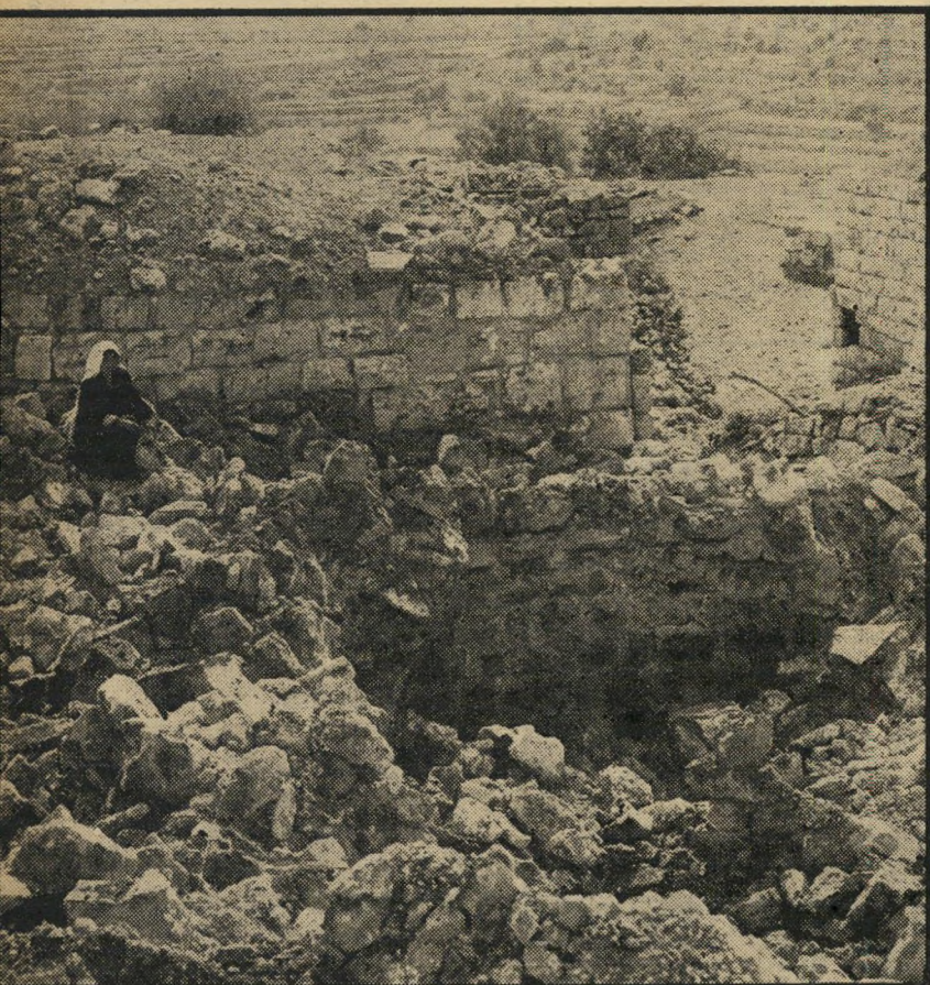
כאן עמד ביתה על חורבות ביתה בכפר חלחול, שליך חברון, יושבת זקנה ערביה ומתבוננת אל גלי האבנים שהיו את ביתה.