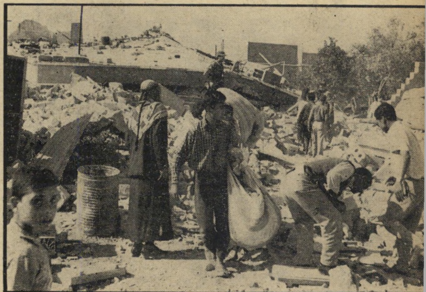
אחפשים שרידי רכוש תושבי הבתים שפוצצו בעזה, הורשו אחרי הפיצוץ לחטט בין ההריסות אחרי שרידי רכוש אותו לא הספיקו לפנות. בתמונה נראים תושבים נושאים מרונים ודפוסים אחרים.

כך חד-משמעית כי פיצוץ בתים מהנה עניין נש מרתיע, מן הגמנע הוא להתחכך עימו על כך. אולם העובדות הידועות שפורסמו מוכיחות בדיוק את ההיפך. גל הסיור בתוך השטחים המוחזקים ובשטח ישראל לא הצטמצם כתוצאה מפיצוץ בתים, אלא התרחב והחמיר. שרשרת הפיצוץ בבתי המגורים בחיפה היא הדוגמה הבולטת ביותר לכך. לפחות באיזור הצפון ברור כי מבצעי שרשרת החבלות נהנים משיטוף פעולה עם שותפים מקומיים הנותנים להם יד והמסתירים אותם מבלי שכוחות הביטחון יוכלו לתפסם.