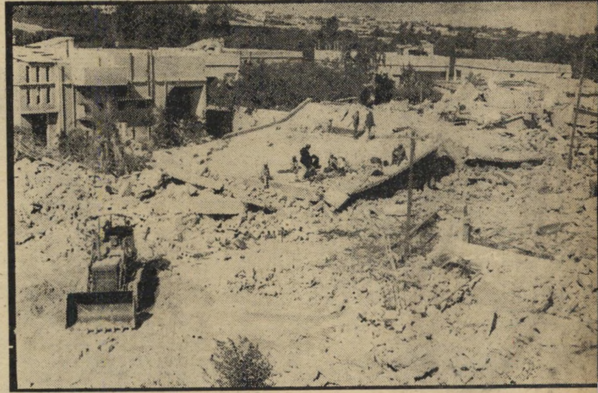
דחפור מגלח רחוב שעה שחיילים ניצבים על גגו השכוב של בית, שקרס מעוצמת הפיצוץ, כבר מתחיל הדפור. לגלח את השטח ולנקותו מההריסות. תוך שעות לא יישארו סימנים שבמקום ניצב פעם רחוב.