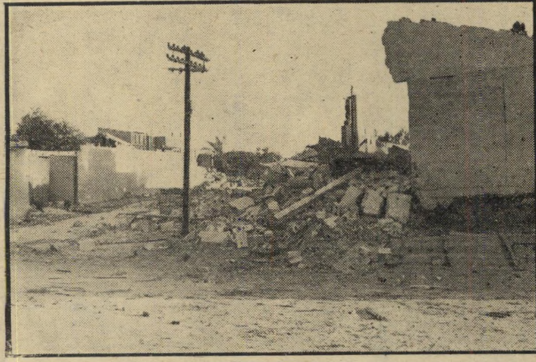
עזה - אחרי הרחוב בעזה אחרי הפיצוץ. רק עמודי החשמל נשארו שלמים. שלושת הבתים הנראים עדיין שלמים בתמונה למעלה, נהרסו. אחד המיבנים שנהרסו ברחוב זה היה בית דפוס שביצע עבודות עבור הממשל הצבאי.

השבוע, בהופיעו בקול ישראל, קבע שר הביטחון משה דיין בצורה ההלית: אין תשובה אחת וכוללת על מעשי החבלה. פיצוץ בית הוא עונש אחד מרבים, אבל גם אם אין ההרתעה מוחלטת, הוכח כי יותר מכל גורם אחר היתה לו עד כה השפעה מרעית על האוכלוסייה מפני מתמיד לטי"ר, רור".