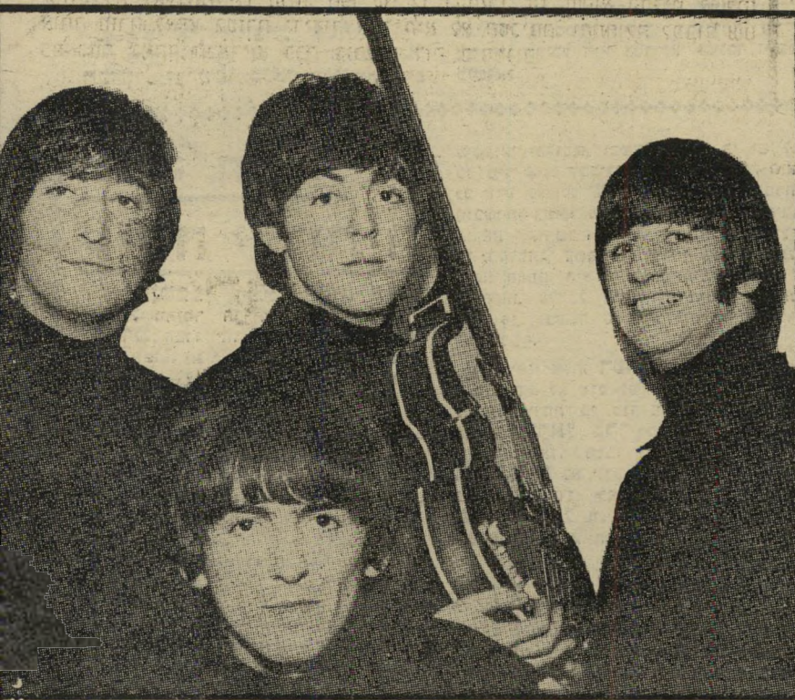
פול מקרטני (במרכז) לפני שבע שנים