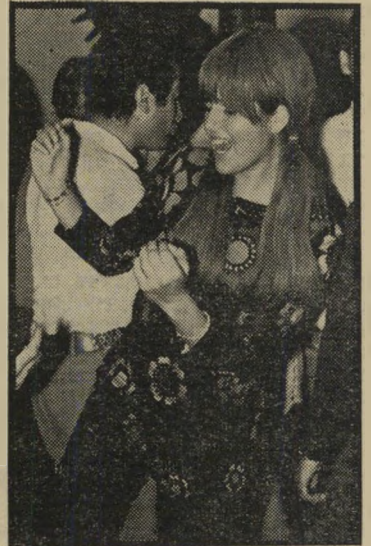
לוריין: אחרי העבודה

את השנייה איפה סגן דודו, וישר אין להן על מה להסתכל. בעיר הוא פשוט לא יכול לעבור בשקט ברחוב, ובדירתו ה"ישנה לא הפסיק הטלפון לצלצל. יום אחד גמאס לו. הלך ומצא ארבע נפשות עם בעיות דומות, והחמישה שכרו יחד דירה בלי טלפון בסביבה שקטה. תקופת מה חיו בשקט, מפני שאם חתיכה כבר הגיעה עד שם, היא לא ידעה על מי להסתכל קודם